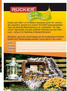
POS-Teilnahmekarten (Vorder- und Rückseite)