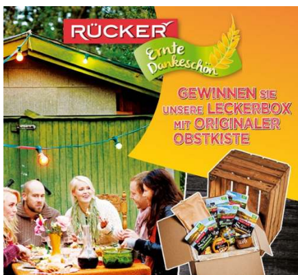
Key visual RÜCKER „ErnteDankeschön“